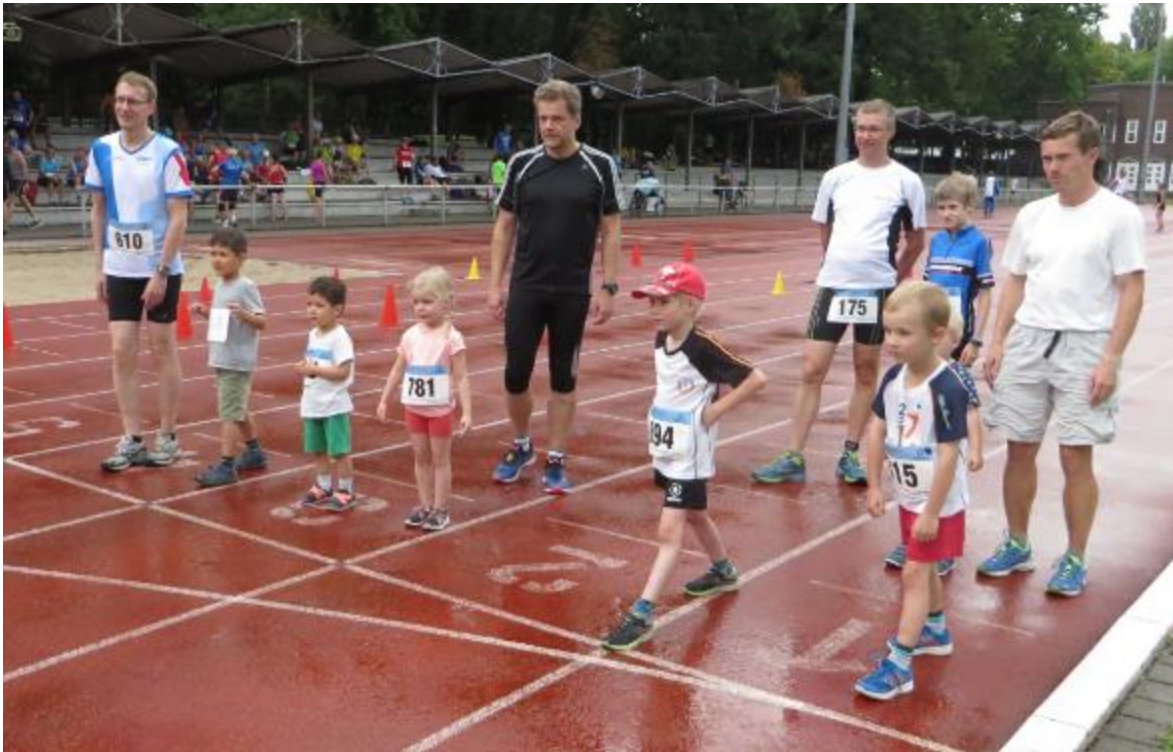
Start zum Kinderlauf auf regennasser Bahn