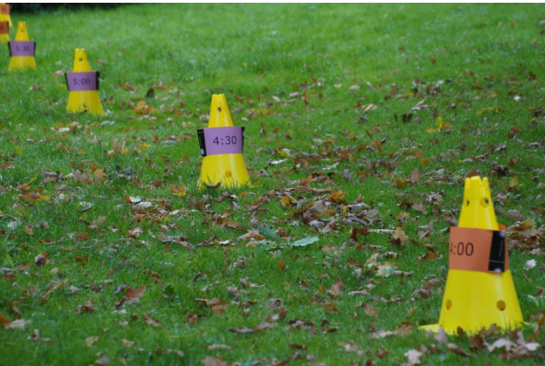
Die Startblöcke sind nach dem geplanten Kilometerschnitt aufgestellt.

Zum Abschluss noch ein paar Bilder, welche zum größten Teil von Torsten Utta stammen.